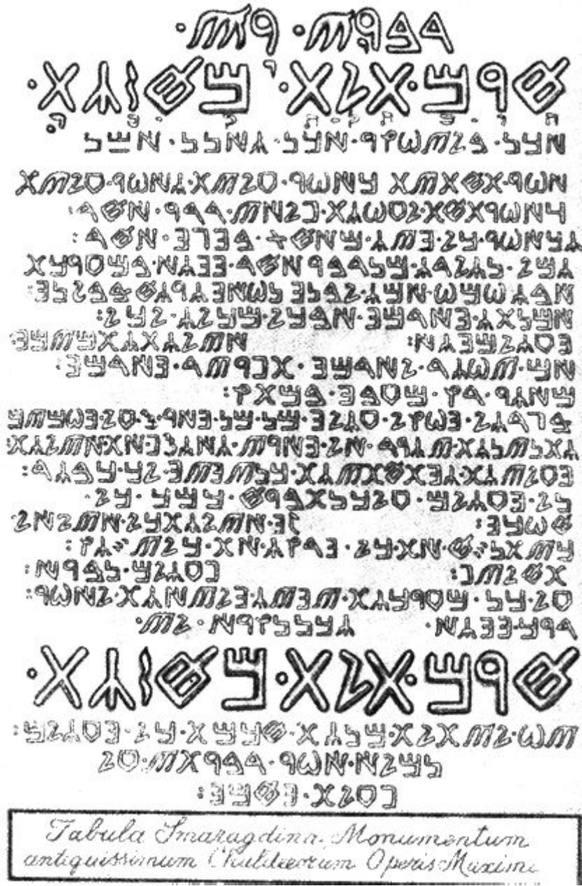
Изумрудная Табличка Гермеса

В редком, неопубликованном древнем манускрипте, посвященном ранним мистериям Массонства и Герметизма, содержится следующая информация, касающаяся таинственного Универсального Агента, называемого «Хирам» (Хирам):